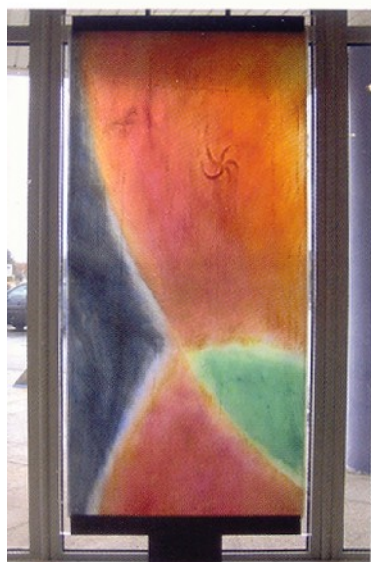
Intervention dans la Polyclinique Saint-Odilon, (Moulins-sur-Allier).

Le procédé mis au point par Udo Zembok paraît simple : des plaques de verre float industriel plat sont saupoudrées de pigments de verre coloré. Chaque couche (jusqu'à sept) est teintée différem-